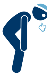
Sensación de falta de aire